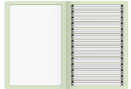
Geschichten- und Gestaltungsheft